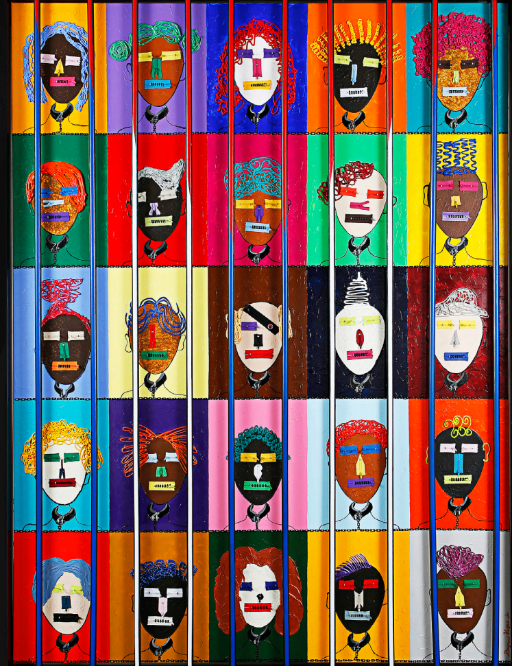
Dayamí Hayek Diptyque Cuba, 2019 Collage, 1.90m x 2.40m (x 2)