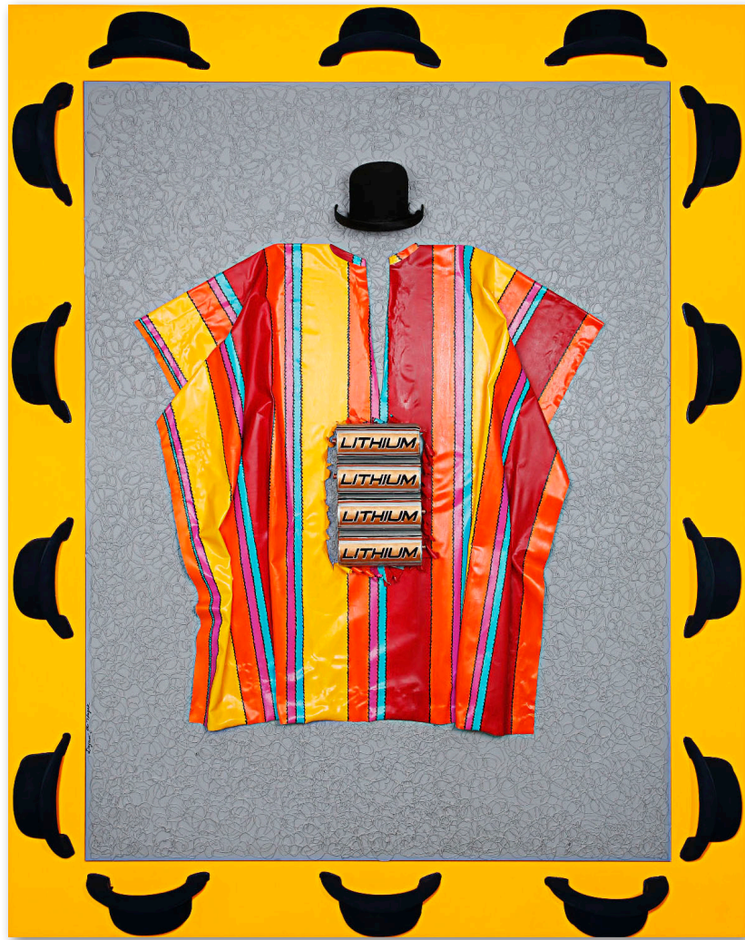
Dayamí Hayek Bolivia, 2019