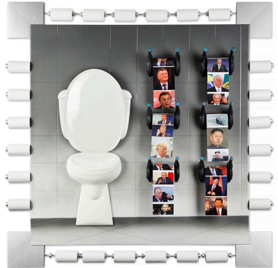
Dayamí Hayek WC, 2017