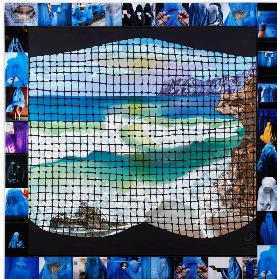
Dayamí Hayek Burka: See As They See, 2018