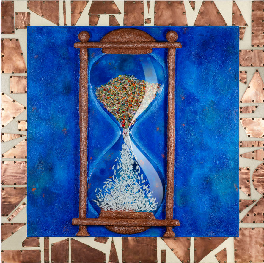
Dayamí Hayek Fragments #5, 2021