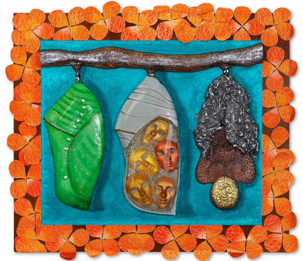
Dayamí Hayek Fragments #2, 2021